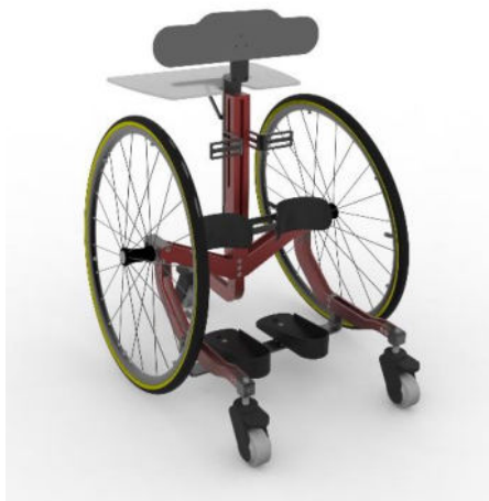
Fig. - Jupiter

Dispositivo medico Jupiter è uno stabilizzatore mobile, fornito dalla Ditta Biemme Group S.r.l. di Reggio Emilia o da fornitore autorizzato è progettato per assistere il bambino durante l'esercitazione della posizione eretta, con possibilità di autopropulsione durante mantenimento di questa posizione. E' disponibile in due misure Standard e Big.